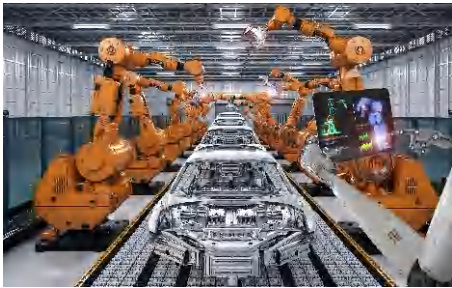
Rctswgu lpf wutlrgu